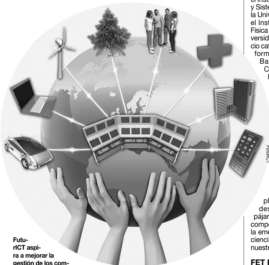
FuturICT aspira a mejorar la gestión de los complejos problemas globales que afectan a la sociedad mediante el uso de las herramientas de la ciencia.

Todo ello requiere el uso de infraestructuras de supercomputación, de la metodología del estudio de sistemas complejos en el nuevo esquema de Ciencias Sociales Computacionales, el des-