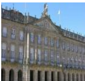
Sede de La Xunta de Galicia, Santiago de Compostela

27 April 2015 por Patricia Mármol - DatacenterDynamics